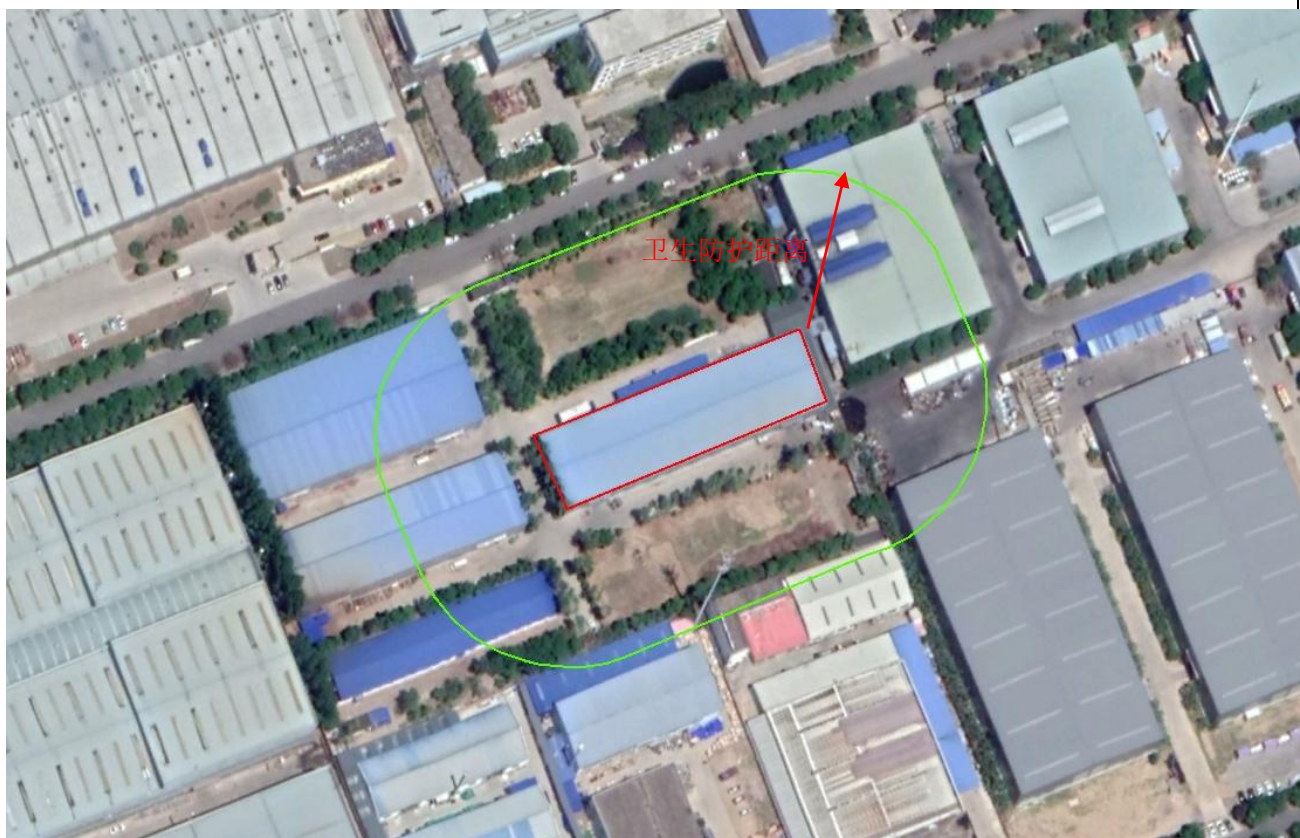
图 7-1 本项目卫生防护距离图

由表可以看出，生产车间设置的卫生防护距离为 1.381m，按照《制定地方大气污染物排放标准的技术方法》GB/T3840-91 中的取值规定，确定本项目卫生防护距离为生产车间外 50m，该防护距离范围内无居民、医疗卫生机构及学校等环境敏感建筑。