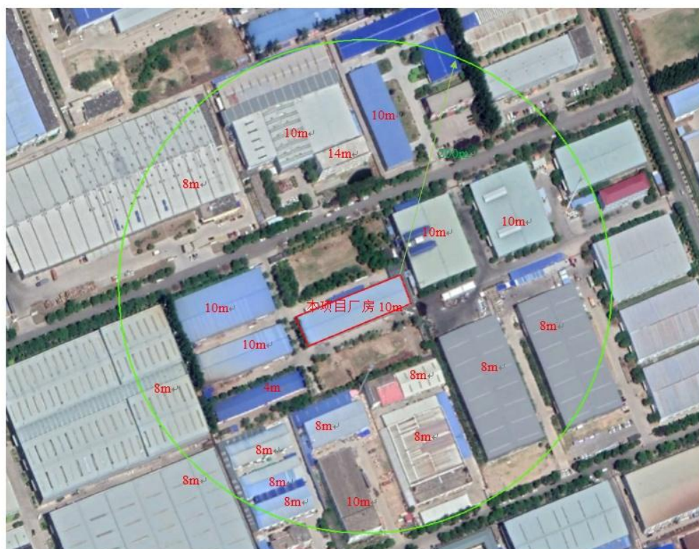
图 5-2 本项目周边 200m 范围内建筑物高度