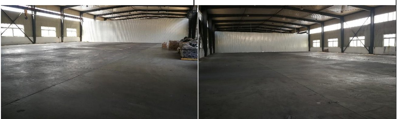
图 1-4 项目建设地点现状

本项目位于天津市武清区大王古经济开发区泰元道 5 号，租赁天津市百环工贸有限公司现有 1#厂房。厂房原为天津市百环工贸有限公司用于生产金属门窗和幕墙，厂房现已清空，目前为空置，不存在原有污染情况和环境问题。项目租赁的厂房已取得天津市武清区环境保护局批复《天津百环工贸有限公司年产金属门窗 2 万平方米、幕墙 3 万平方米建设项目项目》（津武环保许可表[2007]005 号），详见附件。