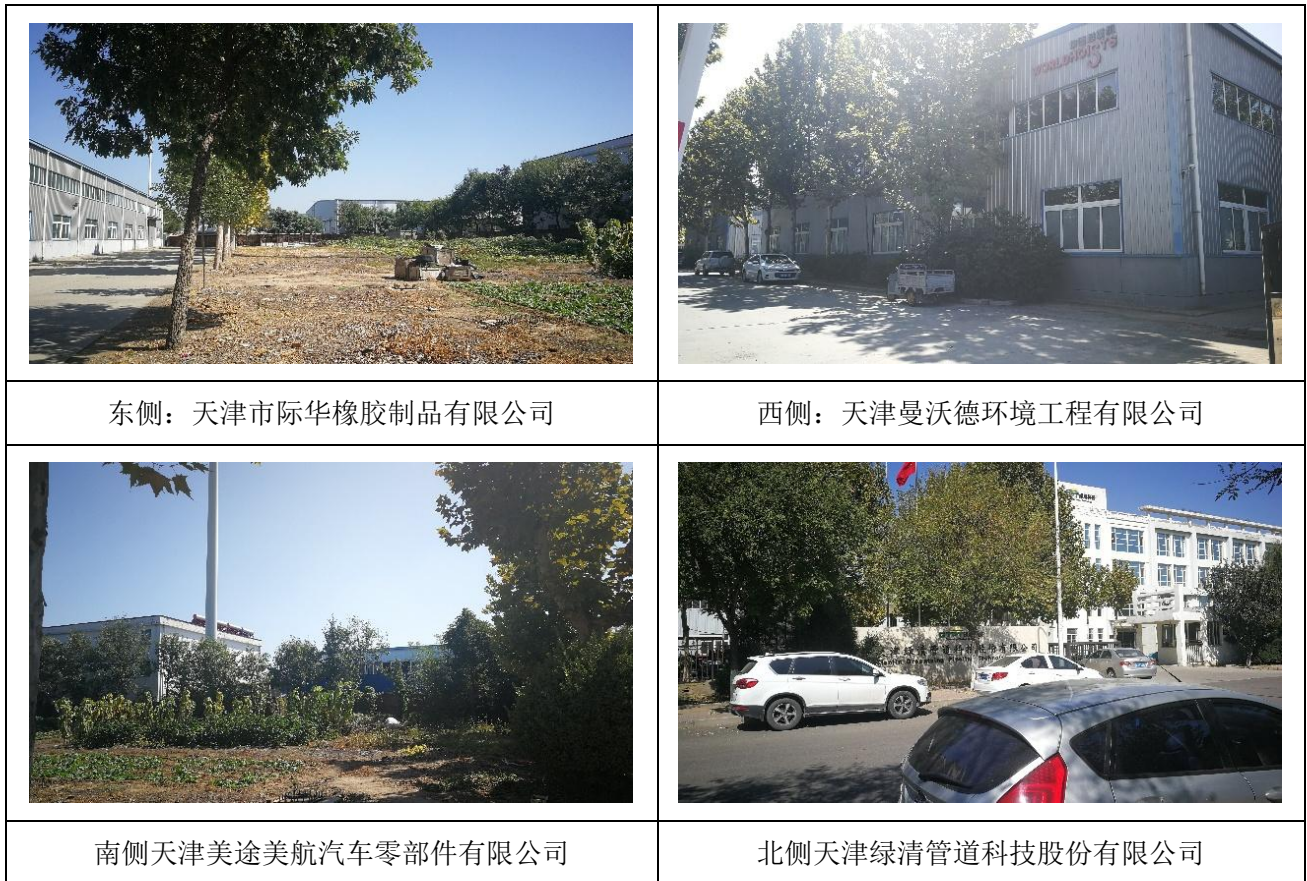
图 2-1 项目建设地点四周情况

本项目位于天津市武清区大王古经济开发区泰元道 5 号，租赁天津市百环工贸有限公司现有 1#厂房，中心坐标为东经 116°48'38.83"，北纬 39°33'57.58"，厂区四至：东至天津市际华橡胶制品有限公司，西至天津曼沃德环境工程有限公司，南至天津美途美航汽车零部件有限公司，北隔泰元道为天津绿清管道科技股份有限公司。