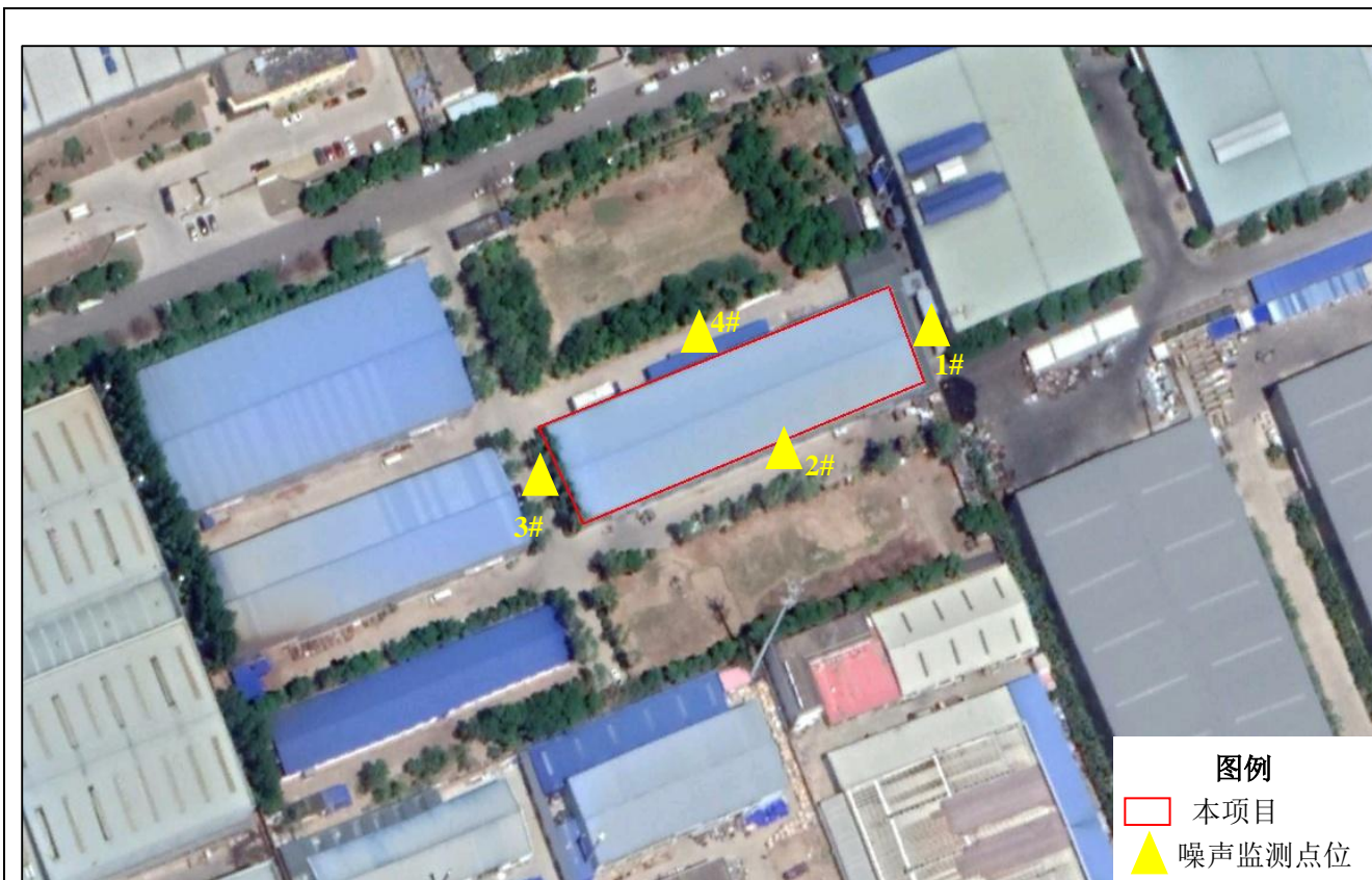
图 3-1 监测点位示意图